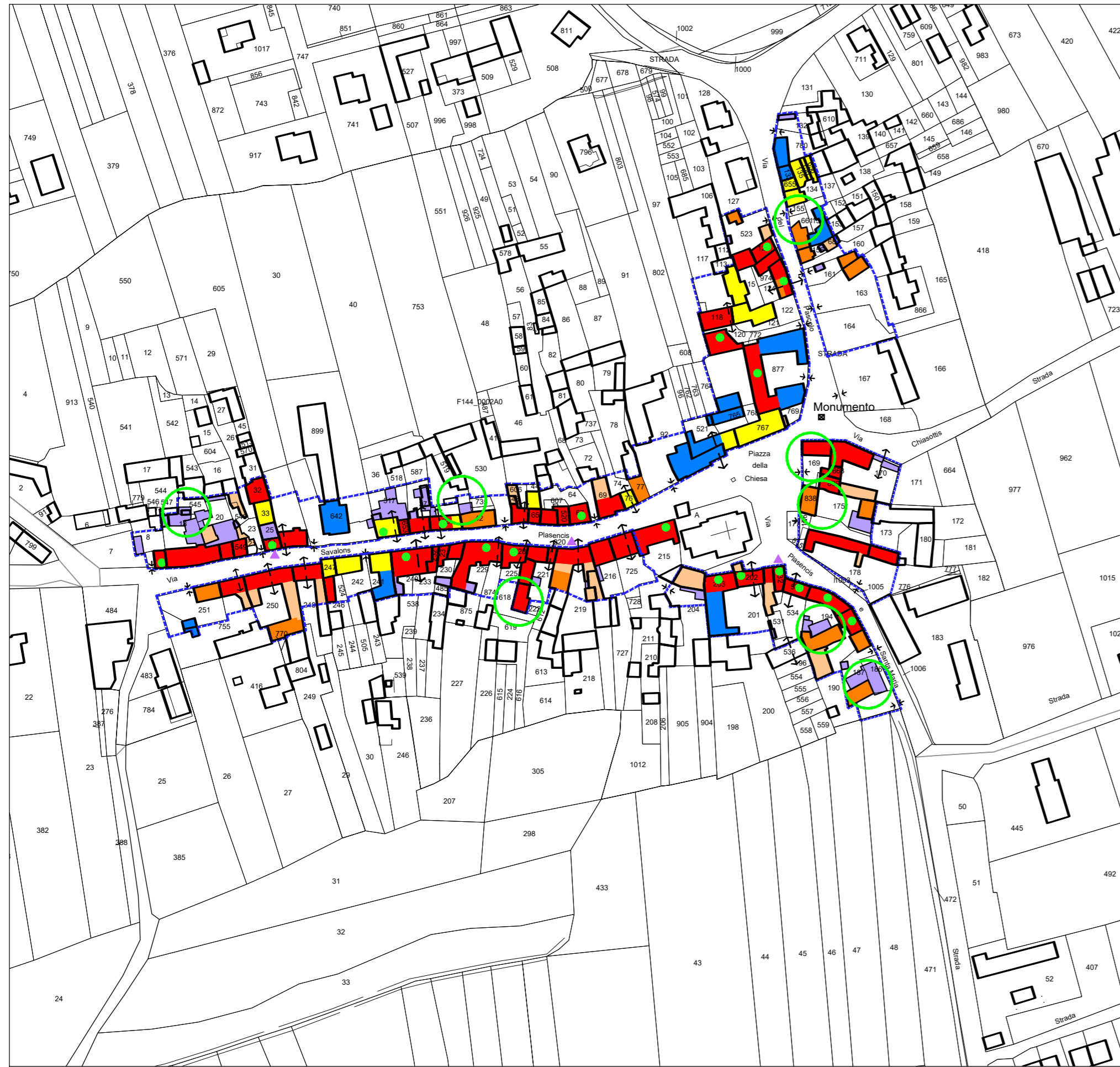
Frazione Plasencis Scala 1:2000