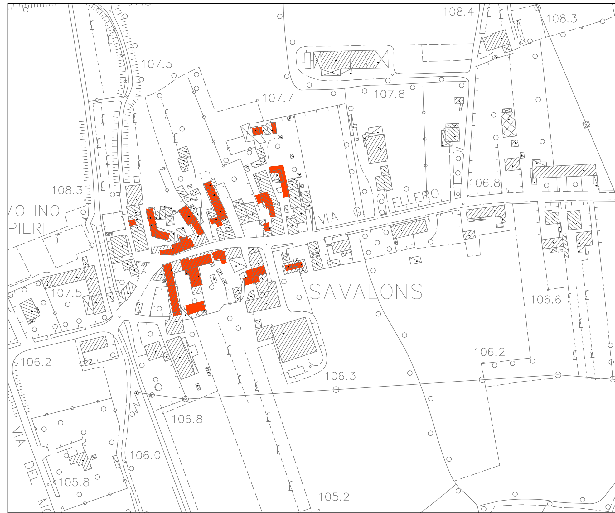
SAVALONS Scala 1:2000